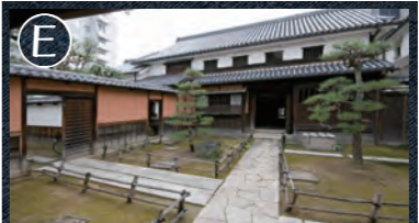
E 国重要文化財 大橋家住宅 長屋門や倉敷格子などを備えた重厚な造りの倉敷を代表する町家のひとつ。