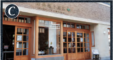
C 林源十郎商店 旧林薬品を改装し、デニムや生活雑貨、飲食などを扱う店舗が入居する現代施設。