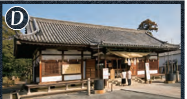
D 阿智神社 美観地区にある鶴形山の山頂に鎮座する倉敷の鎮守。日本一のアケボノフジ「阿智の藤」が有名。