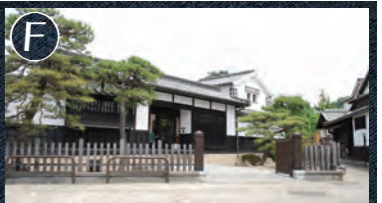
F 倉敷物語館 江戸時代中期に建設された旧東大橋家住宅を改修した観光・文化施設。