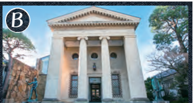
B 大原美術館 大原美術館は、1930(昭和5)年に創設された日本初の西洋美術中心の私立美術館です。