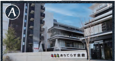
A あちてらす倉敷 様々なジャンルの料理店やホテル、ジーンズショップ等からなる複合施設。